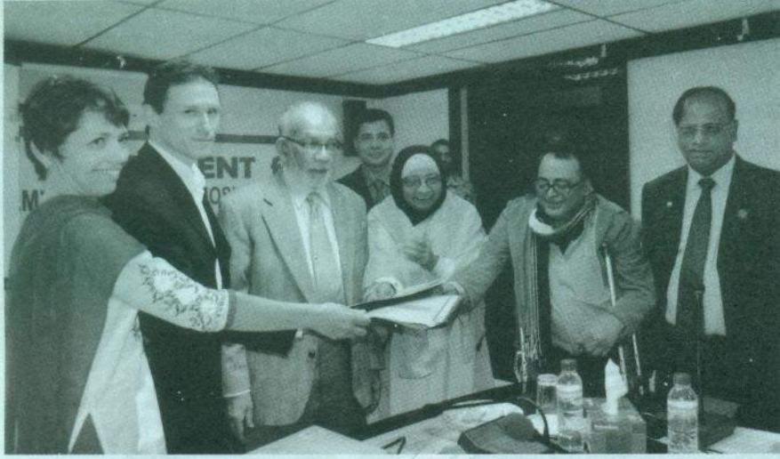
চট্টগ্রাম মা ও শিশু হাসপাতালের সাথে এএমডি ফ্রান্স, কেএমডি ও এসএআরপিডি-এর সমঝোতা স্মারক অনুষ্ঠানে অতিথিবৃন্দ।

চট্টগ্রাম মা ও শিশু হাসপাতালের সাথে ফ্রান্সের বেসরকারী সংস্থা AMD (Aide Medicale et Developement), KDM (Kine du Monde) ও SARPV (Social Assistance and Rehabilitation of People Vulnerable) এর সাথে চট্টগ্রাম মা ও শিশু